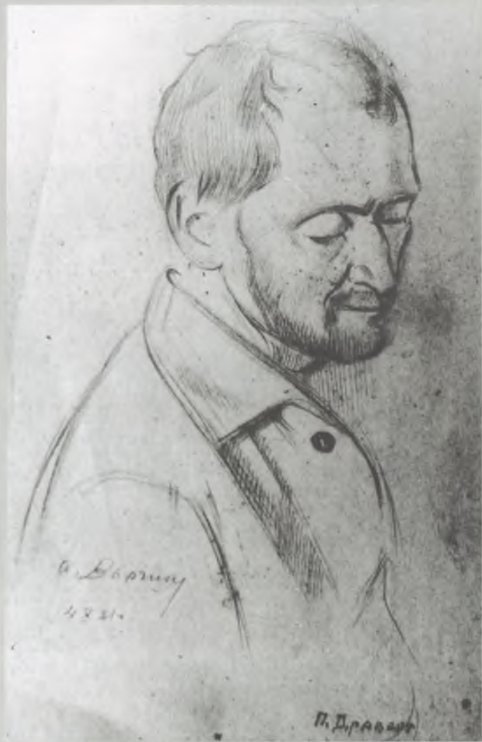
Рисунок неизвестного художника, 1931

Текст | Александр ЛЕЙФЕР