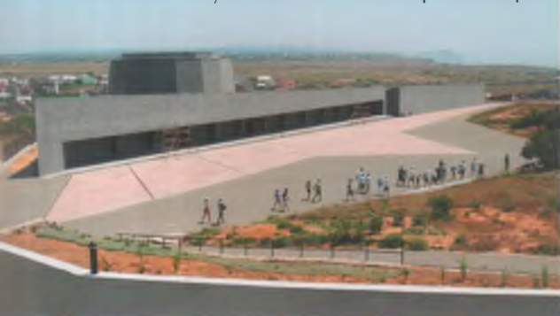
Пантеон Памяти музейного комплекса «35-я береговая батарея»

место в транспортном «Дугласе», который доставил его на кавказский берег (см.: Александр Широкоград. «Трагедия Севастопольской крепости» — М., 2005, стр. 370).