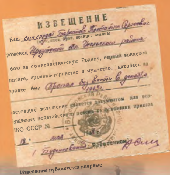
Извещение публикуется впервые