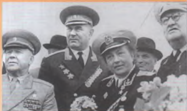
Участники второй обороны Севастополя на юбилейных торжествах в честь освобождения города, май 1964-го