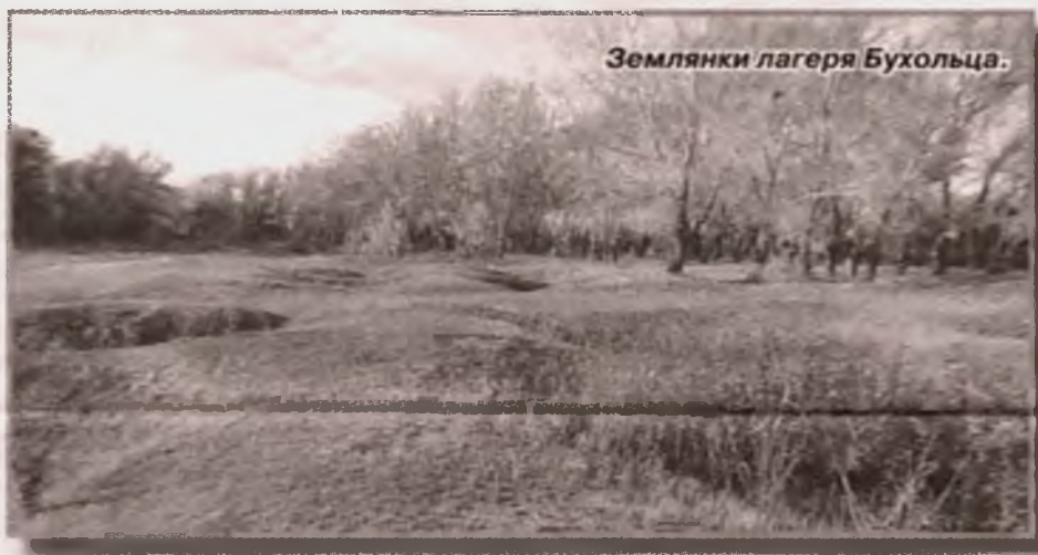
Землянки лагеря Бухольца.

Есть в Павлодарской области замечательное село - Ямышево. Первое русское поселение на территории современного Казахстана. В 2015 году его жители будут справлять трехвековой юбилей со дня основания. А день тот хорошо известен. 1 октября 1715 года (по старому стилю).