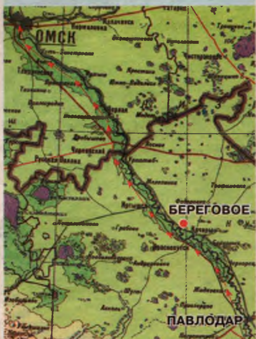
Село Береговое - населенный пункт, до которого в настоящее время добрался Виктор Гоношилов.