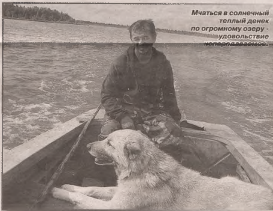
Мчаться в солнечный теплый денек по огромному озеру - удовольствие непередаваемое.