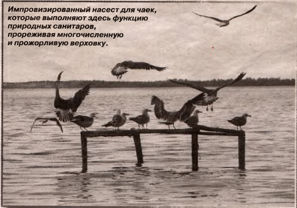
Импровизированный насест для чаек, которые выполняют здесь функцию природных санитаров, прореживая многочисленную и прожорливую верховку.

отправились измерять самые высокие из отмеченных нами муравейников. Выше 130 сантиметров не обнаружили ни одного!