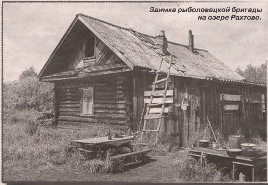
Займка рыбаков бригады на озере Рахтово.