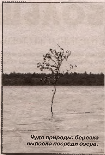
Чудо природы: березка выросла посреди озера.

Нет, мы не бежали в панике. Вернувшись к месту высадки, отдохнули, так как вымотались изрядно и сильно страдали от жажды, еще от багульника у обоих разламывало головы, взяли рулетку и