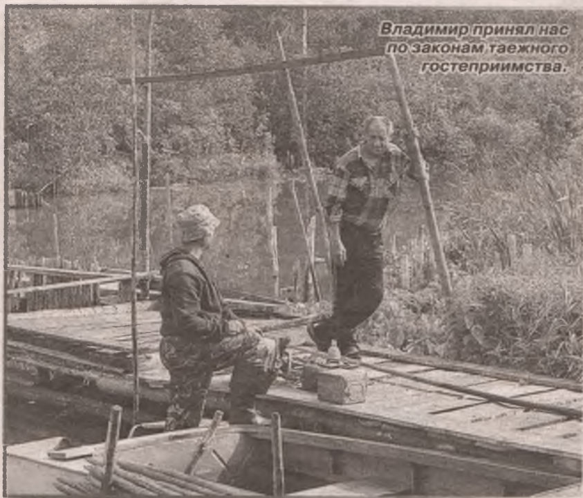
Владимир принял нас по законам таежного гостеприимства.

В лес же идут налегке, бросят в заплечный мешок полдесятка малосольных огурцов да полбуханки хлеба. Считают: мол, вернусь - дома наемся. Не хотят понимать, что болото забирает много сил. Походка в тяжелых сапогах целый день по мху! А потом ведра три-четыре ягод на себе высасывает. Вот оно и не выдерживает. Пошатнется мужик, схватится за грудь, охнет - и нет в его теле жизни больше. Несут потом самого из болота. Иной, уже дома, на крылечко присядет, чтоб сапоги снять, - и не подымеется больше.