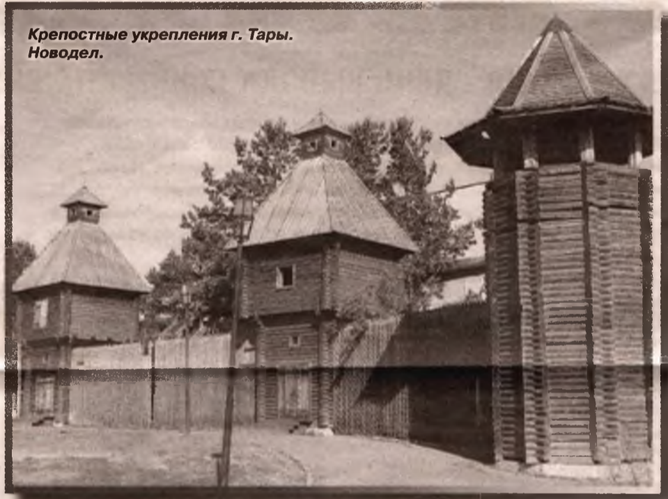
Крепостные укрепления г. Тары. Новодел.

По направлению с севера на юг меняются не только люди и природа, меняются храмы. Например, Усть-Ишимскую и Знаменскую церкви можно смело сравнивать с выставками старинной иконописи. В этих православных храмах среди икон современных мастеров очень много икон деревянных, старинных. А вот в Тарском храме старинные образа, их около полудесятка, теряются среди современных. В советское время в Таре жил перекупщик икон. Деревянные православные иконы он отправлял в Прибалтику за очень хорошие деньги, цена порой достигала стоимости автомобиля. Из Прибалтики православные иконы уходили на Запад. Видимо, по этой причине всего одна старинная икона, причем выполненная на картоне, находится в Большереченской церкви.