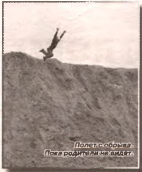
Полет с обрыва. Пока родители не видят.

- Вы не подскажете, можно ли в Коренево найти бабушку-долгожительницу со светлой головой, - обратился я к покупателям в местном магазине. - И чтоб общительная была.