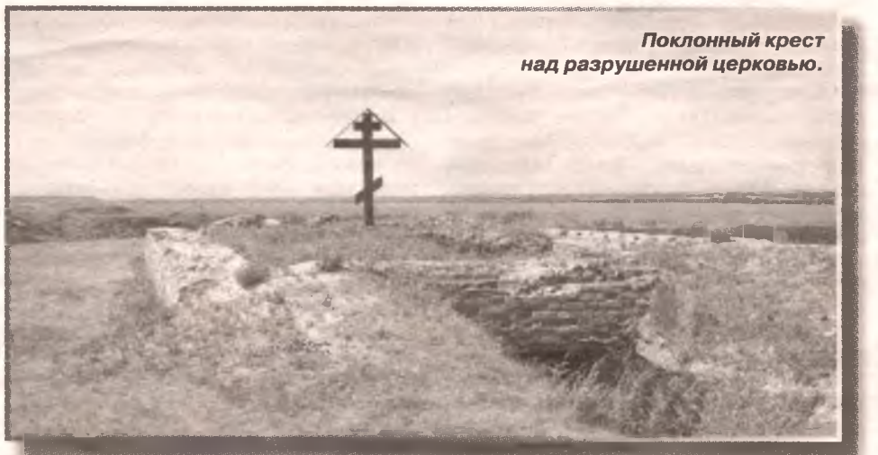
Поклонный крест над разрушенной церковью.