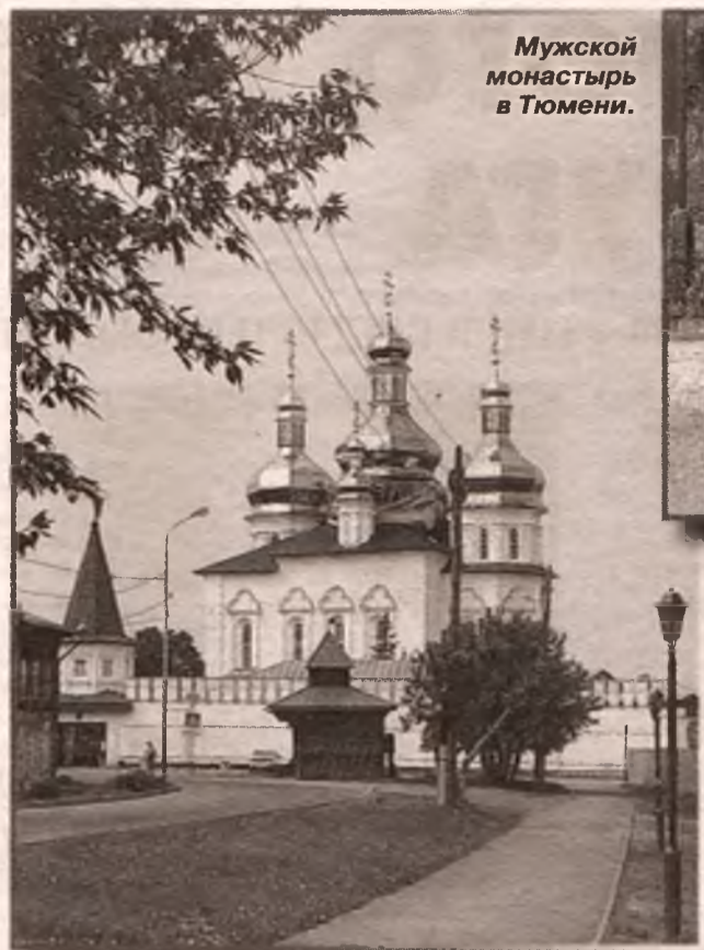
Мужской монастырь в Тюмени.

Большевики, сменившие временное правительство, уже Тобольск посчитали ненадежным местом для ссылки царя.