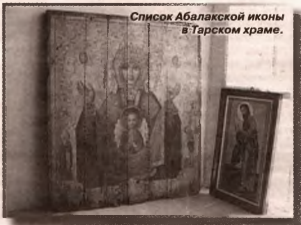
Список Абалакской иконы в Тарском храме.

Икону, обретенную храмом древнего сибирского города, должны изучать профессионалы. Рядовому журналисту вся ее глубина не откроется.