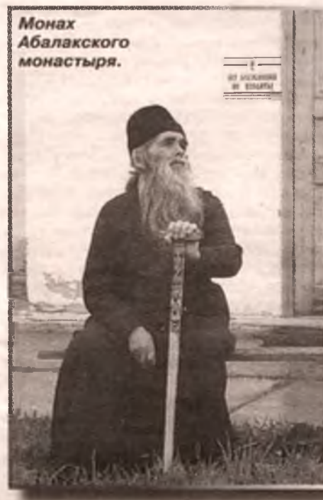
Монах Абаклацкого монастыря.

Давно известно, что гордыня - один из самых больших грехов. Мы же все равно ею грешим. И автор этих строк не исключение. Вместо того, чтобы начать пеший путь по следам омских паломников, как