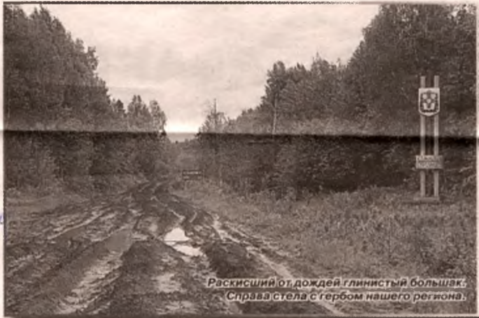
Раскисший от дождей глинистый большак. Справа стела с гербом нашего региона.

А дорога точно такая же, как на тюменской стороне. Раскисший от дождей глинистый большак. В шесть утра я вышел с места стоянки теплохода «Заря» у села Абаул Тюменской области, последним тюменским населенным пунктом перед Омской областью, и в четыре дня подо-