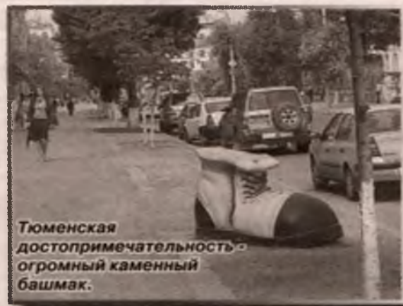
Тюменская достопримечательность - огромный каменный башмак.

Появление креста связано со следующим событием. Когда Временное правительство отправило Николая Второго в сибирскую ссылку в Tobolsk, то в Тюмени, на берегу Туры, царь с семьей прямо из поезда (ветка железной дороги подходила к пристани) пересел на паром, и по Туре, впадающей в Tobol, его довезли до Tobolska.