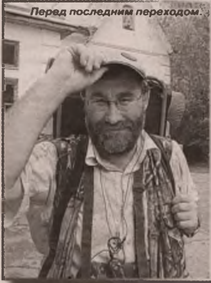
Перед последним переходом.

плечами. Раскинуть же палатку негде. Пойдет территория нефтезавода. К городу, переправившись на пароме с левого берега Иртыша на правый, я приближался со стороны Красноярки. Требовалось пойти на рывок. Это как последний, решающий штурм войны, когда потерь не считают. Потому что сбереги сейчас сотню жизней, но не добейся победы, потом придется положить тысячи. Мне было жаль вещей, я с ними сроднился, как с живыми. Но ситуация требовала решительности. И я совершил подвиг, перешагнув через душевные мучения. Ни один сторонний человек этого не поймет. Это надо пережить.