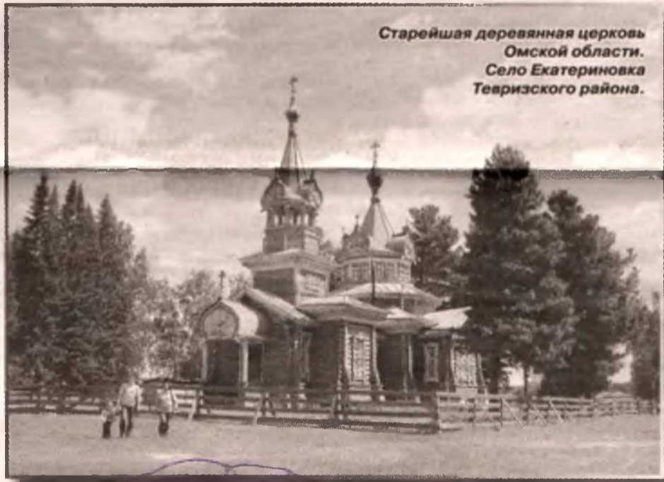
Старейшая деревянная церковь Омской области. Село Екатериновка Тевризского района.

Почему в десять вечера я начинал принуждать себя отправляться на ночевку? По простой причине. Боролся с идиллией обилия сил в теле. К девяти вечера уличная жара спадает, а если день дождливый - машин на дороге меньше, организм обретает второе дыхание. Идти легко. Ты уверен, что сил хватит еще на пять-восемь километров. И их действительно хватает на этот путь, но уже не достает, чтобы аккуратно поставить палатку, сменить мокрую от пота одежду на сухое теплое белье, пройтись по телу влажной салфеткой, смазать кремом или антибактериальной мазью ступни ног, залезть в спальник, неторопливо распечатать продукты и с удовольствием поесть.