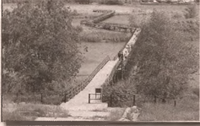
Самый длинный пешеходный деревянный мост Омской области. Тевриз.

В моем личном архиве собран достаточно большой перечень загадок самой разной масштабности: от местных краеведческих до вселенских. И самая загадочная среди них - чутье моего спасителя. Как он сумел угадать самый уязвимый для меня участок пути? Так выпал на тот день мой суточный переход, что ни одна из деревень не находилась ближе трех-четырех километров от дороги. А это, учитывая путь туда и обратно, блуждания по незнакомому селу, очередь в магазине, - три-четыре бездарно потерянных утомительных часа. 10-12 километров из моих 30 на день.