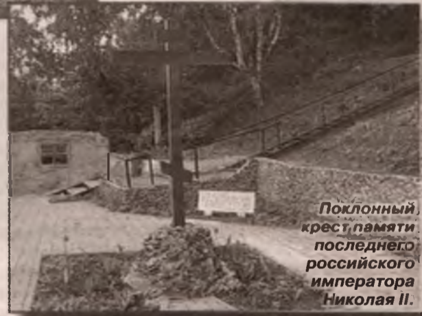
Поклонный крест памяти последнего российского императора Николая II.

Площадка у поклонного креста Николаю II выложена каменной плиткой. Каждый день после вечерней трапезы монашки совершают к нему крестный ход. Крест расположен в пойме Туры. К нему ведет лестница из 77 ступеней. Над крестом возвышается увал. На этом увале монашки создали террасную клумбу. Склон укрепили кирпичными стенами и высадили цветы. Когда они расцветут, крест будет стоять на фоне сплошного цветника.