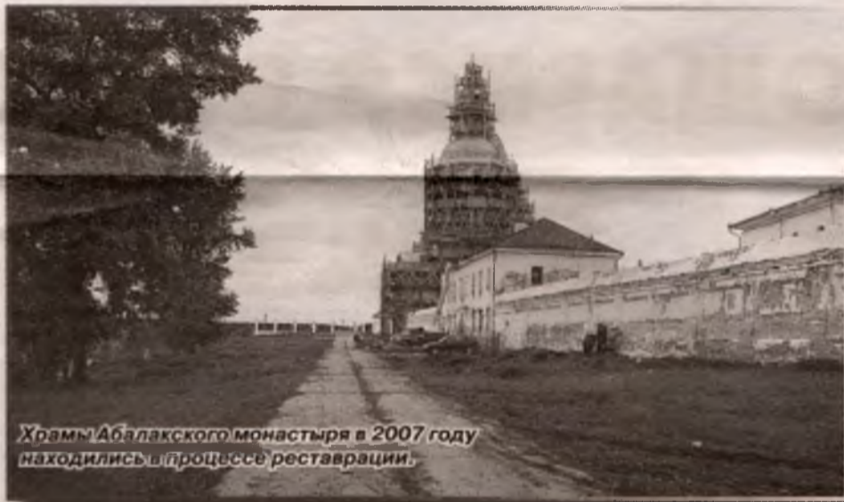
Храм Абалакского монастыря в 2007 году находились в процессе реставрации.