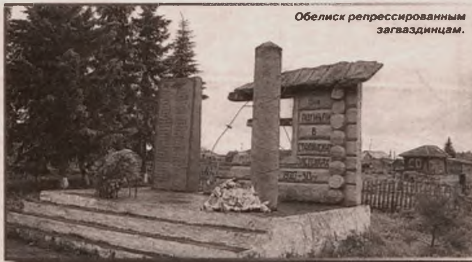
Обелиск репрессированным загваздинцам.