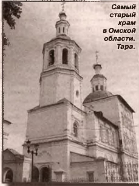
Самый старый храм в Омской области. Тара.

жаре, ополаскиванием рта проблема не снимается.