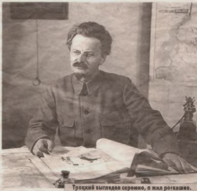
Троцкий выглядел скромно, а жил роскошно.

Со слов Троцкого, побег выглядел следующим образом. У него в подметках еще до ареста были спрятаны фальшивый паспорт и золотые червонцы. Поэтому финансовая сторона дела его не тревожила. Трудность заключалась в следующем. Бежать из Обдорска можно было только на оленях. Но где взять проводника? На выручку пришел местный крестьянин по прозвищу Козья Ножка. Он нашел для Троцкого проводника из местных зырян. Пьяницу и пройдоху ужасного. Однако дело он свое знал. За неделю, сменив две тройки оленей, зырянин доставил Троцкого до предгорий Урала. Олени - эти на редкость благородные и выносливые животные - сутками бежали без сна и еды, лишь раздува-