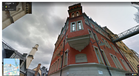
Дом детектива-журналиста Микаэля Блумквиста. Стиг Ларссон «Миллениум». Стокгольм, Швеция. Скриншот с Google

Улица Морг из рассказа Эдгара Аллана По вызвала затруднения при создании игры. В действительности её не существует, однако в рассказе автор указал точные ориентиры, поместив вымышленную улицу между реально существующими — Ришелье и Святого Роха. Осталось только выбрать подходящую под описание в рассказе улицу и отправить по ней участников тревел-квеста.