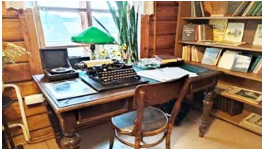
Мемориальный дом-музей И.П. Пожалостина, Солотча

Пожалостина, Паустовский полюбил еще в 1930 году. Он снимал летний домик на этом участке, жил там каждое лето, писал рассказы, а позднее выкупил и главный дом дачи, где отдыхал уже в старости.