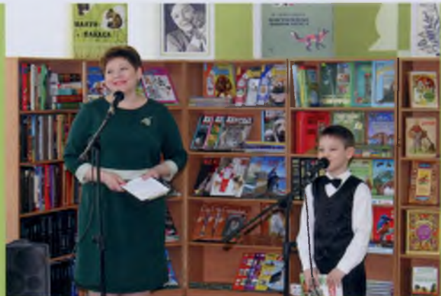
В день открытия библиотеки имени В. Чаплиной