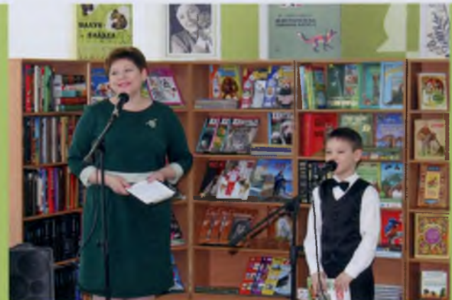
В день открытия библиотеки имени В. Чаплиной