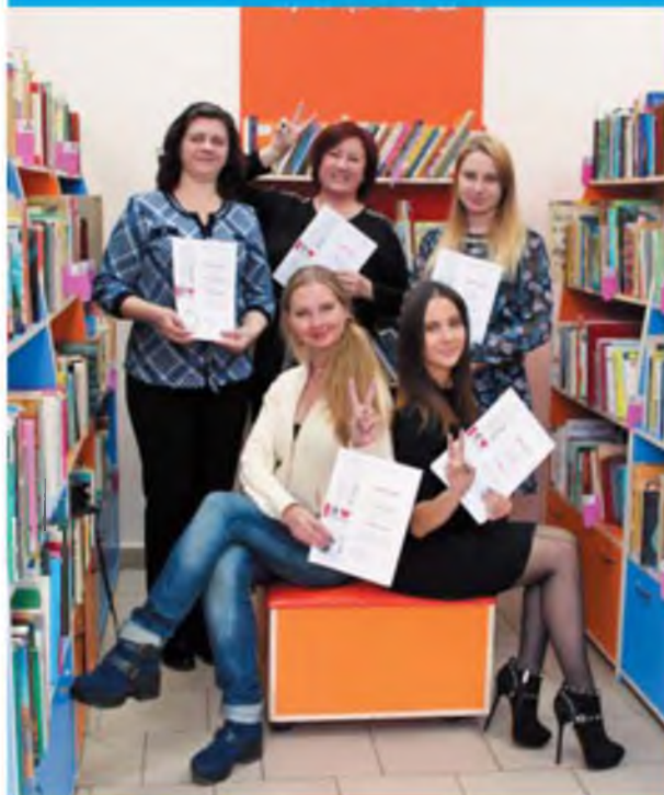
Награждение в Центральной городской библиотеке