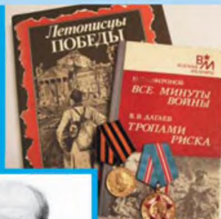
Дедушкины книги и медали

Уже 23 года его нет с нами. И я, как всегда, с особым трепетом перелистываю семейный альбом. Пожелтевшие от времени снимки лучше всяких слов говорят о том, что дедушка работал в маленьком деревянном клубе, приобщал к чтению своих земляков в селе Троицкий Сунгур Ульяновской области. А еще по крупицам собирал свою собственную библиотеку. Это были целые тома о живописи, которой он тоже занимался, запечатлевая в акварели природную красоту родной округи, военные серии и, конечно же, художественная литература – от Пушкина до Шолохова. Любил дел книги. И меня, маленькую девчущку, наставлял: «Надо больше читать. От книг много пользы. Они нас жизни правильной учат. И на всяк вопрос в них есть ответ».