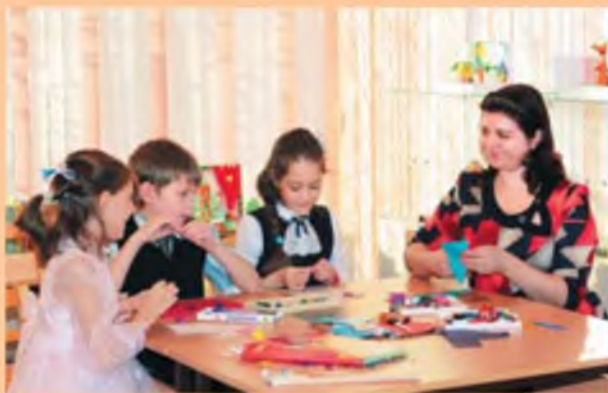
Занятия в интернет-студии «Волшебный сундучок» и на Белозеровской полянке