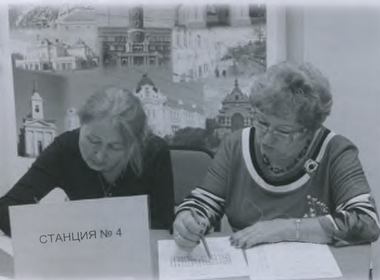
Городской компьютерный турнир «Шпионские штучки», октябрь 2016 г.

Появилась и интересная традиция – ежегодные встречи выпускников курсов. Впервые подобное мероприятие произошло в октябре 2016 г. в форме интеллектуального квеста под интригующим названием «Шпионские штучки». К участию приглашались выпускники как первого, так и второго курсов, которым предсто-