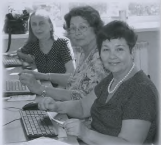
Группа № 8, май 2016 г.