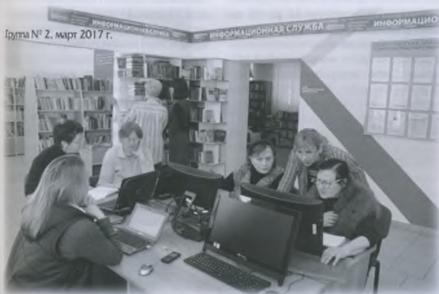
Группа № 2, март 2017 г.

Стоит отметить, что ни разу не возникло проблем с набором студентов на курс. Пенсионеры с готовностью откликнулись на нашу инициативу. Учитывая популярность проекта, в 2015 г. было решено привлечь к его реализации и другие муниципальные библиотеки. Если в 2014 г. было обучено всего 10 человек, то в 2015 г. сертификат получил уже 181 выпускник курса. В конце 2015 г. специалисты ЦГБ выиграли грант, поддержка которого осуществлена региональным благотворительным фондом «Самарская губерния» на средства, предоставленные АО «Райффайзенбанк». Проект получил название «Цифровой ликбез» и позволил разделить информационный курс на две составляющие. Появилась идея набора слушателей на I курс по компьютерной грамотности, так сказать, «с нуля», и на II курс, когда знания пенсионеров, по их собственной субъективной оценке, позволяли более глубоко погружаться в просторы Интернета, а также знакомиться с различными ресурсами, регистрироваться на многочисленных сайтах, предлагающих государственные и социальные услуги. После окончания всего цикла «Цифрового ликбеза» все слушатели имели возможность записаться на второй курс проекта «Компетентный Е-гражданин». На занятиях возникало множество проблем. Например, неразбериха с уровнем подготовки. И это объяснимо, ведь при наборе слушателей не проводилось тестирование их знаний, распределение по группам шло исключительно на основе мнения самих слушателей. А немногие из них реально оценивали