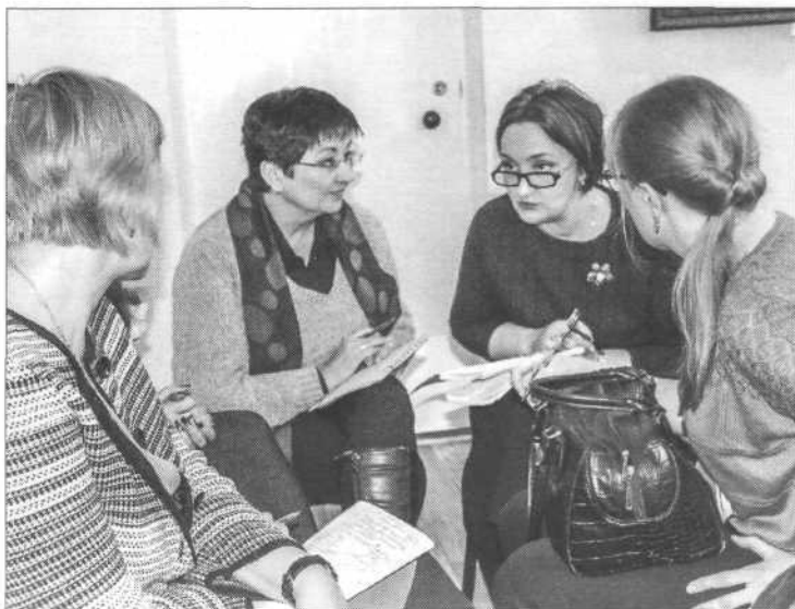
▲ Участники мастер-класса «Социальное проектирование в библиотеке» в ЦГБ г. Омска старались уже на стадии планирования продумать все нюансы реализации своих замыслов

Самарской, Тамбовской и Белгородской областями. Этот момент нужно учитывать.