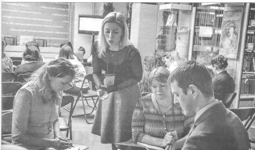
◀ На слёте молодых библиотекарей Тюменской области автор статьи помогала коллегам понять, какие идеи для них приоритетны и могут лечь в основу грантовой заявки

нием? Конечно, цель — это второй вариант. А вот первый — задача, которая помогает достичь поставленной цели.