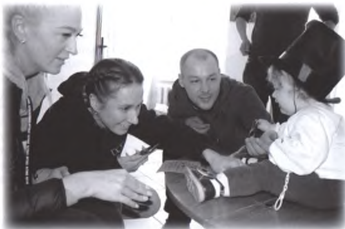
Самый юный организатор автоквеста в роли годовалого Пушкина

нальный литературный автоквест «АВТОр Пушкин» был поддержан грантом в размере 100 тыс. рублей. В смету вошли материалы для выпуска рекламной печатной и сувенирной продукции, изготовления банда с его символикой, а также кубки для победителей, литература о жизни и творчестве А.С. Пушкина для каждого из городов-участников.