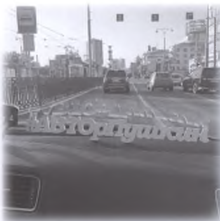
«АВТОР Пушкин» мчится по дорогам Екатеринбурга

К каждой игре мы – специалисты Омских муниципальных библиотек – придумываем интересный сюжет, разрабатываем механизм игры, продумываем маршрут, наполняем локации заданиями, ищем реквизит, занимаемся продвижением события и поиском спонсоров. Разработка игры, которая для игроков длится в среднем 4 часа, занимает около месяца. Поэтому мы за-