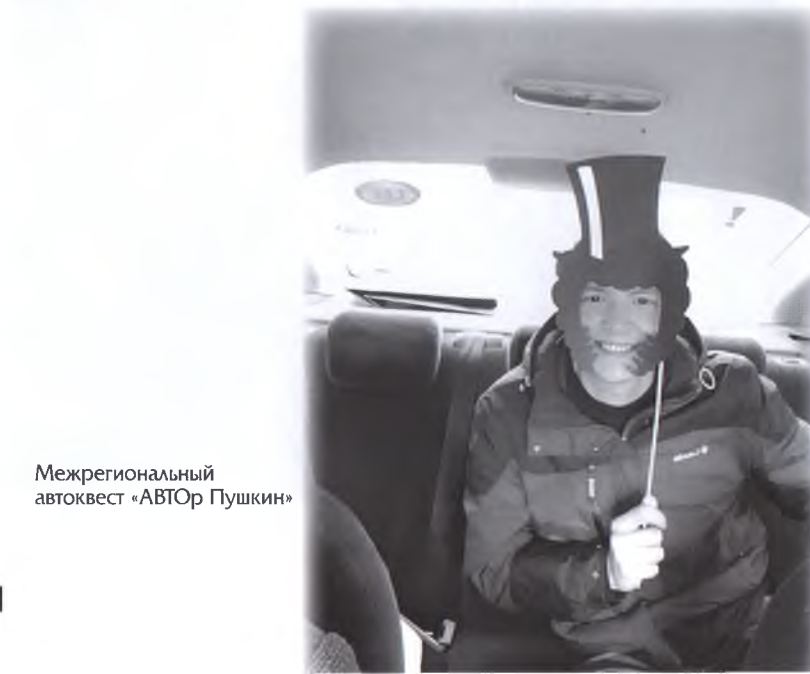
Межрегиональный автоквест «АВТОр Пушкин»

хотели поделиться опытом проведения литературного автоквеста с другими регионами и общими усилиями организовать яркое событие для участников из разных городов.