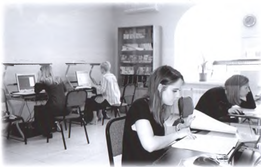
Библиотекари-координаторы команд во время первого автоквеста

В беседе участники скидывали выполненные задания, а библиотекари-операторы отправляли игроков на следующую локацию. Этот достаточно трудоёмкий процесс онлайн-сопровождения позволил командам без ошибок проехать по всему маршруту и получить от прохождения только положительные эмоции.