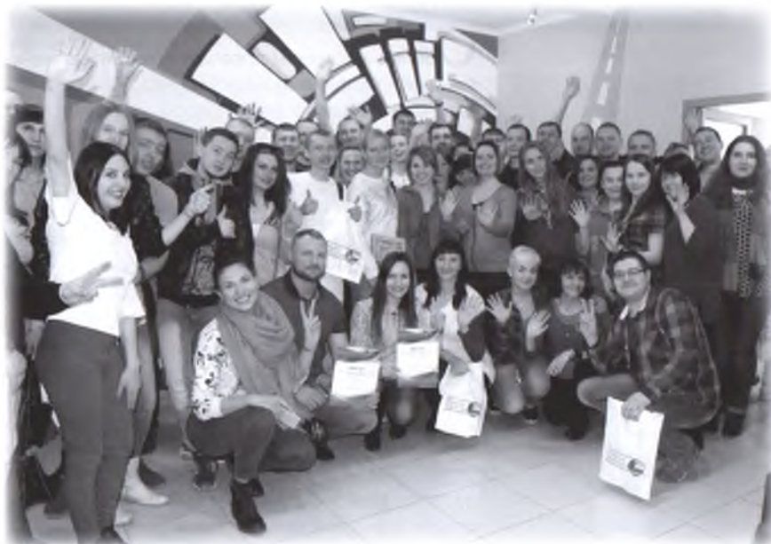
Участники первого автоквеста