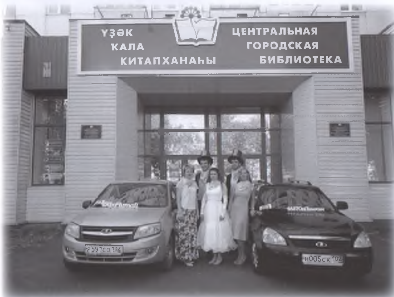
Уфа к старту готова!