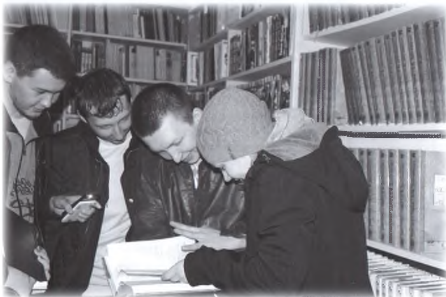
Подсказки можно найти в произведениях Достоевского

Мы считаем, что подобные мероприятия очень важны для имиджа учреждения. Несмотря на яркие события в библиотеках по всей стране, ещё остались молодые люди, которые считают библиотеки несовременными и неспособными удовлетворить их культурные потребности. Организация популярного в молодёжной среде досуга привлекает внимание к качественной литературе, даёт информационный повод для СМИ, меняет отношение к библиотекам как к современным учреждениям культуры. Видеоролики о литературных автоквестах можно посмотреть на официальном канале Омских муниципальных библиотек на видеохостинге YouTube.