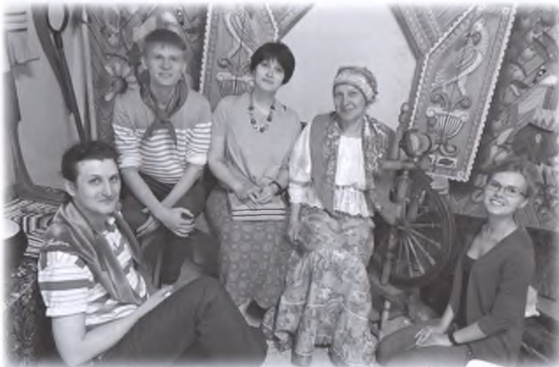
Команда из Новосибирска на одной из локаций