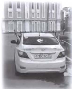
Участники первого автоквеста у острога

«Спасибо огромное за это увлекательное путешествие. Сегодня вы подарили нам море позитива, задора и хорошего настроения. Нас очень порадовал продуманный маршрут литературного путешествия и интересные задания. Для нас, как для опытных квестеров, такое мероприятие от омских библиотек стало настоящим подарком», – отметила одна из команд.