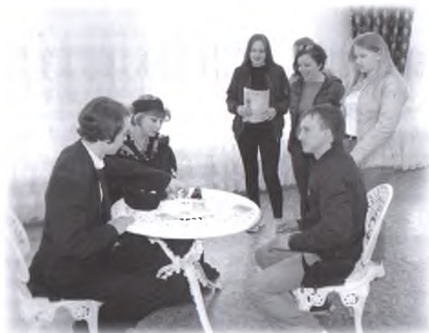
Омичи на локации «Пиковая дама»