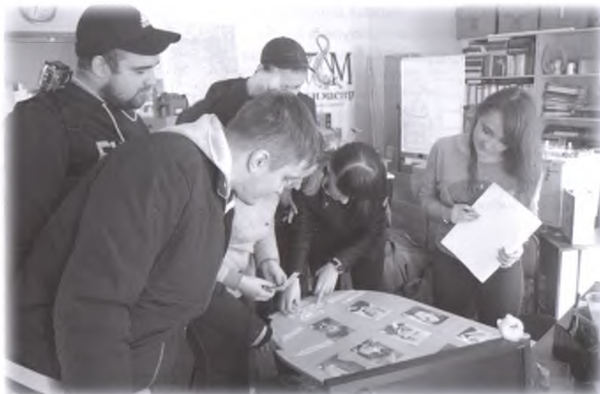
Участники первого автоквеста на локации «Поэт и мастер»