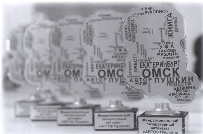
Кубки победителей межрегионального автоквеста