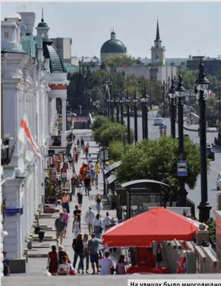
На улицах было многолюдно

Литературная тема – не единственная. Присвоение звания «Город трудовой доблести» отразится на здании бассейна «Юность» и на одном из фасадов близ памятника труженикам тыла. Граффити-искусство увидят и в удаленных уголках города. На КДЦ «Береговой» и