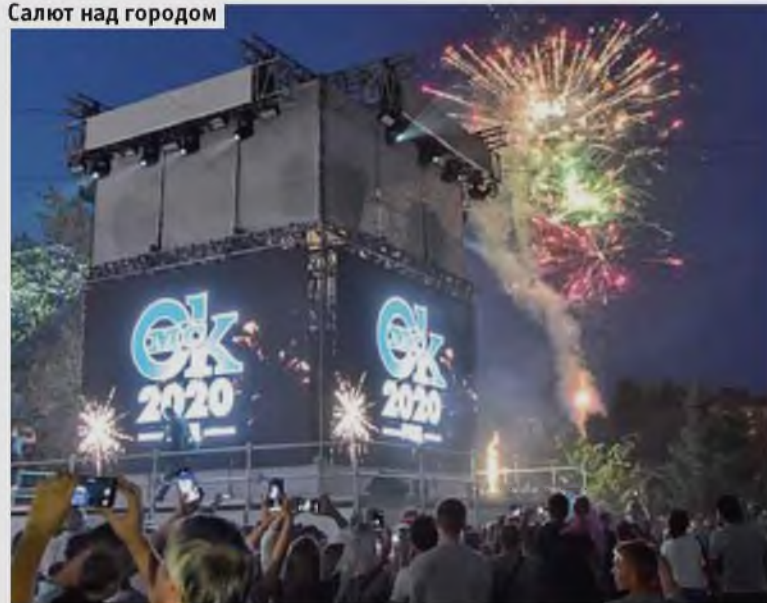
Салют над городом

Вот и стал наш город на год взрослее. Триста четвёртый день рождения был особенным. Впервые Омск отметил его в статусе города трудовой доблести. Большинство мероприятий прошло в онлайн-формате. Поздравления из разных уголков страны и мира, лучшие номера творческих коллективов, мастер-классы, любимые музыкальные композиции транслировались во время многочасового марафона на большом экране в центре города. Однако немало ярких событий всё-таки прошло в привычном режиме. Чем запомнился День города – 2020 – в материале корреспондентов «Вечёрки».