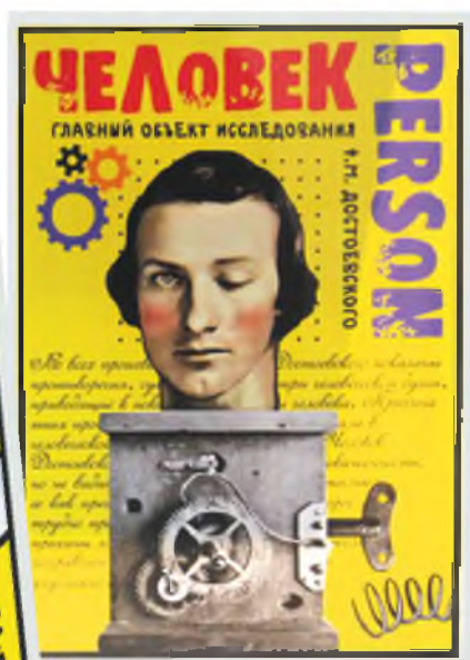
Работы И. Николаева