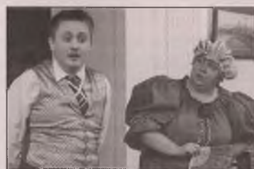
■ Туристы приезжают в Устюжну, чтобы проверить, действительно ли прототипом Хлестакова из комедии «Ревизор» послужил вологодский помещик. Ответ они получают из интерактивной программы, которую готовят специалисты МЦБ имени Батюшковых