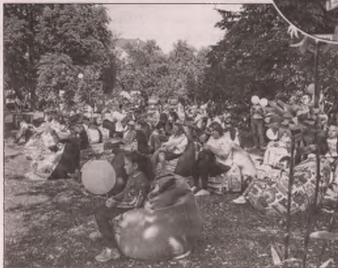
■ «Литературный привал», ежегодно организуемый ЦГПБ имени В.Г. Белинского, — одна из площадок, которую гости города посещают в первую очередь