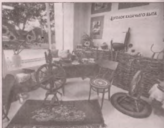
■ Помимо творчества автора «Тихого Дона» специалисты Библиотечно-информационного центра популяризируют казачьи традиции, о которых много писал Михаил Александрович Шолохов

пространство теперь буквально проникнуто донским колоритом. Экскурсии, как правило, приурочиваются к юбилейным и знаменательным датам, связанным с биографией Михаила Шолохова и Донским краем. В эти дни в библиотеке становится особенно многолюдно — мероприятия проводятся для групп. Но познакомиться с уникальными экспонатами можно и в индивидуальном порядке, в любое другое время.