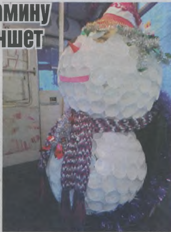
Снеговика из пластиковых стаканчиков установили в салоне одного из трамваев.

После этого жюри выберет самые лучшие послания. Бумажное письмо, адресованное Деду Морозу, можно принести в любую муниципальную библиотеку Омска. Ответное послание - забрать в библиотеке через пару дней. Му-