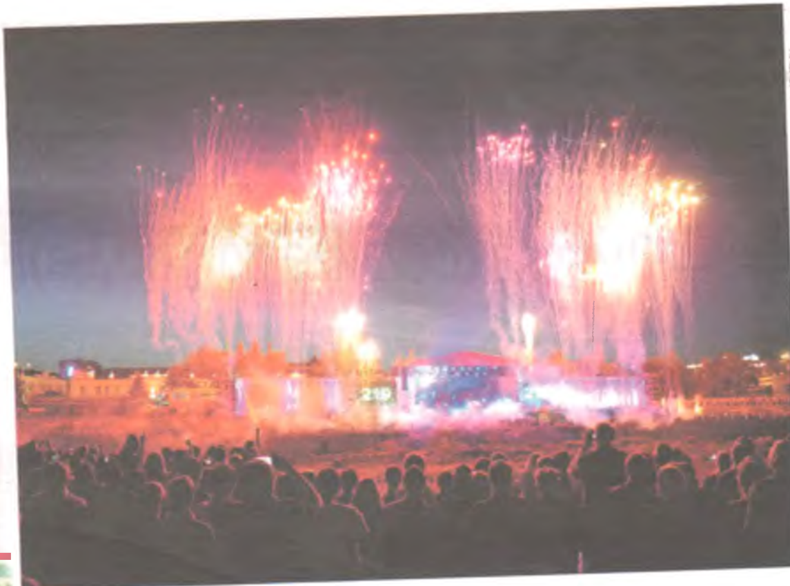
Год назад омичей удивляли фейерверком и лазерным шоу.

- Нынешний праздник - это репетиция 300-летнего юбилея города. Творческими коллективами, администрациями округов, представителями общественности проведена огромная работа, плоды которой жители смогут увидеть, придя на праздник. Надеемся, каждый найдет здесь что-то свое, что-то увлекательное и интересное.