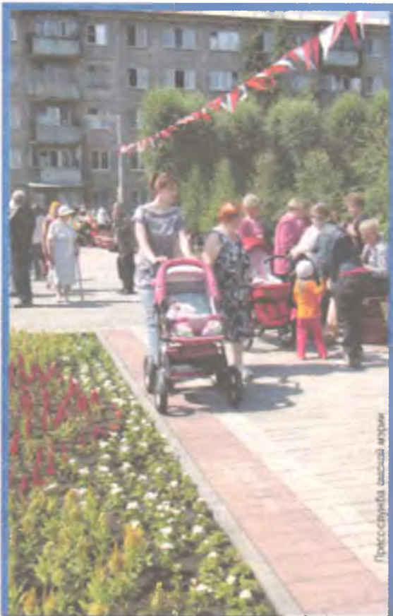
Интересно будет всем - и старшему поколению, и маленьким детям.

но-исторических клубов Сибири и Казахстана. Площадкой для 11-го по счету фестиваля станет парк Победы.