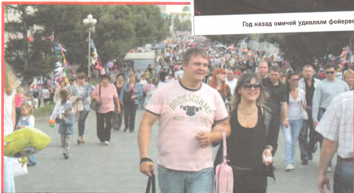
Любинский проспект традиционно станет пешеходной зоной.