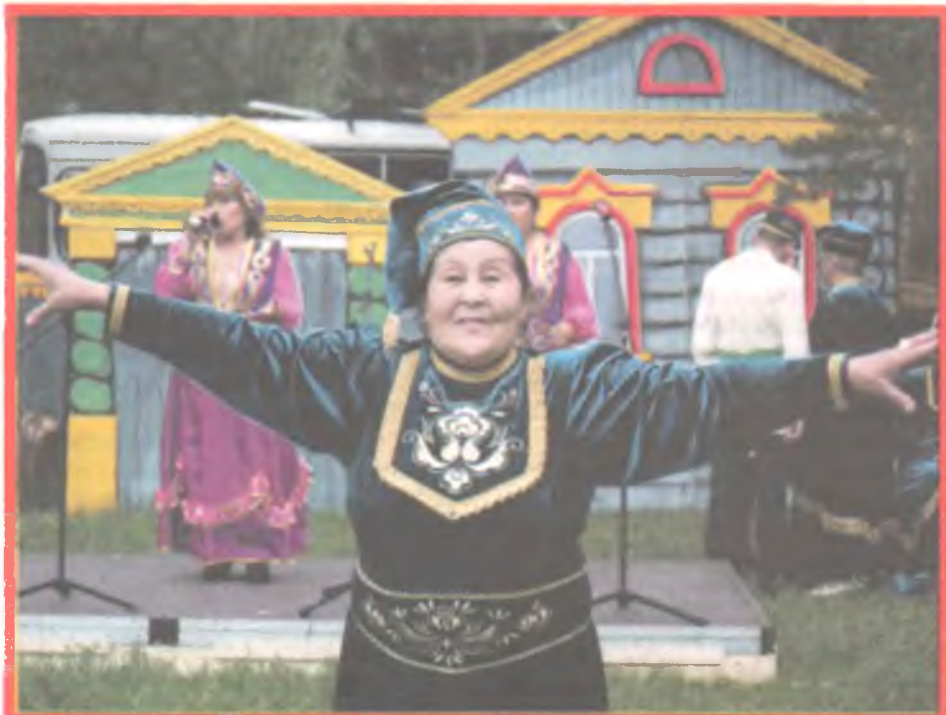
1 августа выступят творческие коллективы из Казахстана и даже Китая.

Выставка будет работать в Доме художника (ул. Лермонтова, 8) с 24 июля по 7 августа ежедневно с 10.00 до 18.00. Справки по телефону - (3812) 56-41-61 (городской музей «Искусство Омска»).