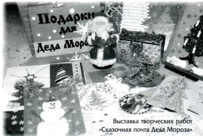
Выставка творческих работ «Сказочная почта Деда Мороза»