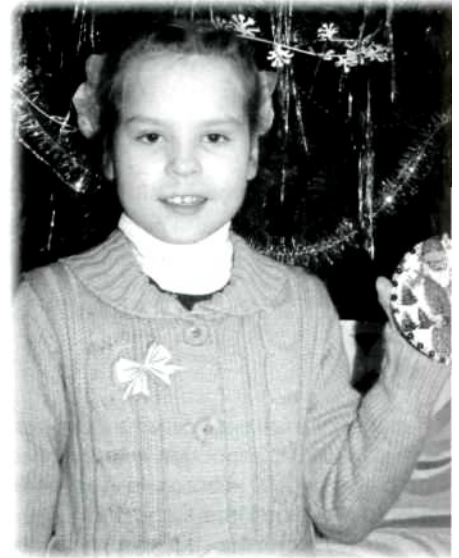
Участница выставки творческих работ «Сказочная почта Деда Мороза»

быстрый и гарантированный ответ в любую точку земного шара. В одном послании из г. Бирска (Республика Башкортостан) 16-летняя девочка написала: «Дедушка Мороз, я раньше тебе писала много писем, но ни на одно из них ты не ответил». В этом году поздравление от Деда Мороза наконец-то дойдёт и до Бирска. А один маленький москвич, получив электронное послание, радостно заявил: «Я так и знал, у Деда Мороза есть компьютер!» «Сказочная почта Деда Мороза» – это пиар-проект. За время его реализации в информационной программе «Вести Омск» ГТРК «Иртыш»