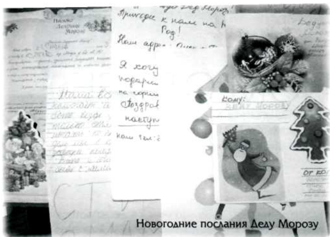
Новогодние послания Деду Морозу