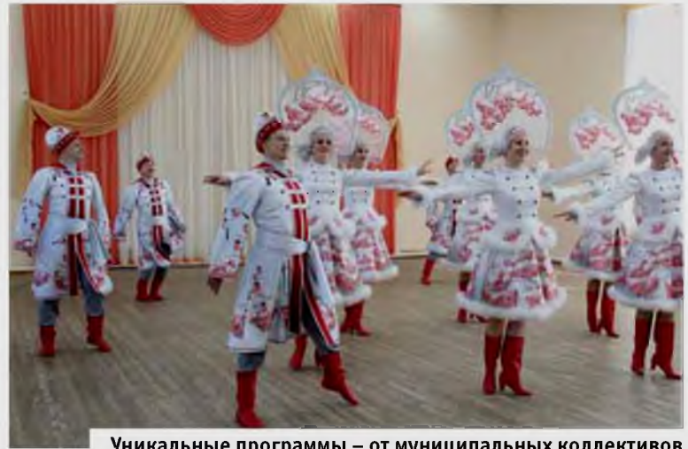
Уникальные программы – от муниципальных коллективов