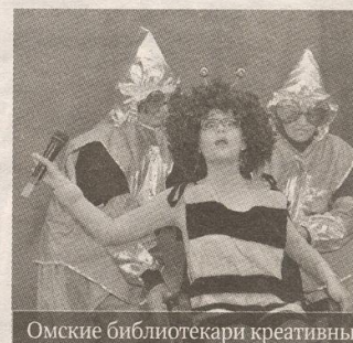
Омские библиотечки креативны.