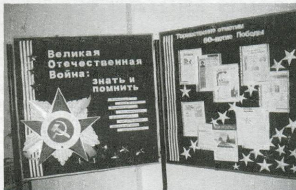
Выставка в методотделе: «Великая Отечественная война: знать и помнить»

В рамках программы «Я тоже частица России» библиотеки ЦСМБ проводили цикл праздничных мероприятий «Весь май Победой освещен» (всего 36 мероприятий для 1230 чел.) Библиотеки совместно с окружными администрациями, КТОСа-ми, ДК, музыкальными школами, собирали в своих уютных и красиво оформленных залах ветеранов войны, тружеников тыла, других пожилых людей на встречи, чтобы поздравить их с праздником. Литературно-музыкальная композиция «Жди меня, и я вернусь» (библиотека им. Маяковского для пенсионеров Нежинского Дома милосердия), вечер-встреча «Вы в битве Родину спасли» (библиотека № 36). Вечер благодарности «Следы войны в моей судьбе» (Первая детская библиотека), вечер воспоминаний «Теперь живу посредине между войной и тишиной» (библиотека им. Ломоносова), встреча ветеранов «Война не бывает далекой» (библиотека им. Маркса). Иногда на такие праздники собирается много жителей микроучастка (округа), и тогда библиотекари переносят действие во двор, как в библиотеках «Мир женщи-