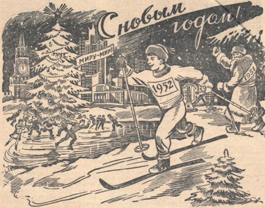
Рис. Н. Сазонова