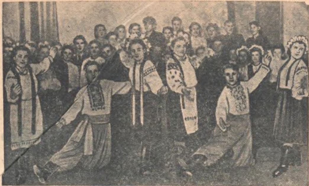
НА СНИМКЕ: выступление коллектива художественной самодеятельности Павлоградского Дома культуры.

Почти тридцать три тысячи пионеров и школьников хорошо отдохнули за лето в пионерских лагерях, на дачах и пришкольных детских площадках. 2,5 тысячи ребят приняли участие в туристских походах и экскурсиях.