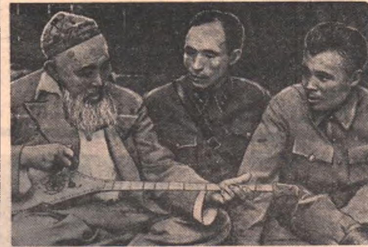
Их девиз — учиться

Коммунистическая партия и правительство уделяют большое внимание дальнейшему обучению молодежи. С каждым годом расширяется сеть вечерних и заочных школ, вечерних и заочных отделений институтов. Только учись!