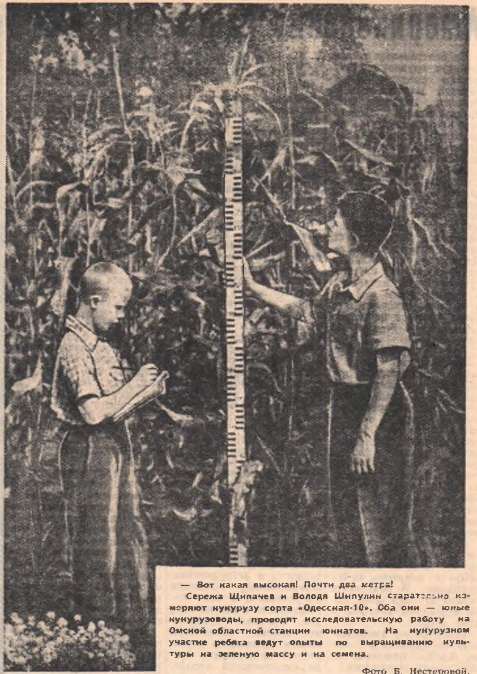
— Вот какая высокая! Почти два метра! Сережа Шипачев и Володя Шипулин старательно измеряют кукурузу сорта «Одесская-10». Оба они — юные кукурузоводы, проводят исследовательскую работу на Омской областной станции юннатов. На кукурузном участке ребята ведут опыты по выращиванию культуры на зеленую массу и на семена.

Кроме того, пионеры взяли под свое шефство 50 гектаров колхозной кукурузы.