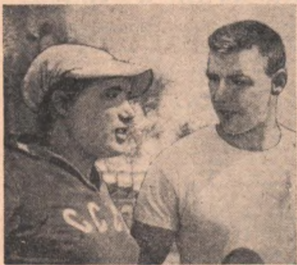
Рим, Олимпийские игры. На снимке: советская спортсменка Тамара Пресс беседует с американским дискоболем Алом Уерттером.

КИНОТЕАТР ИМЕНИ МАЯКОВСКОГО — 1-й зал — новый широкоэкранный фильм «Второе цветение», — в 9, 10-55, 12-50, 2-45, 4-40, 6-35, 8-30 и 10-25 веч. 2-й зал — «Любой ценой» — в 9-30, 11-15, 1, 2-45, 4-40, 6-25, 8-10 и 9-55 веч. «ХУДОЖЕСТВЕННЫЙ» — «Хмурый Вангур» — в 9-20, 11-10, 1, 2-50, 4-40, 6-30, 8-20 и 10-10 веч. «ЛУЧ» — «Новый Дели» — 1-я серия в 11-40 и 4-45 веч. 2-я серия в 1-10 дня. В 9-50 веч. 2 серии в один сеанс. «Седьмое путешествие Синдбада» — в 10, 2-50, 6-15 и 8 ч. веч.