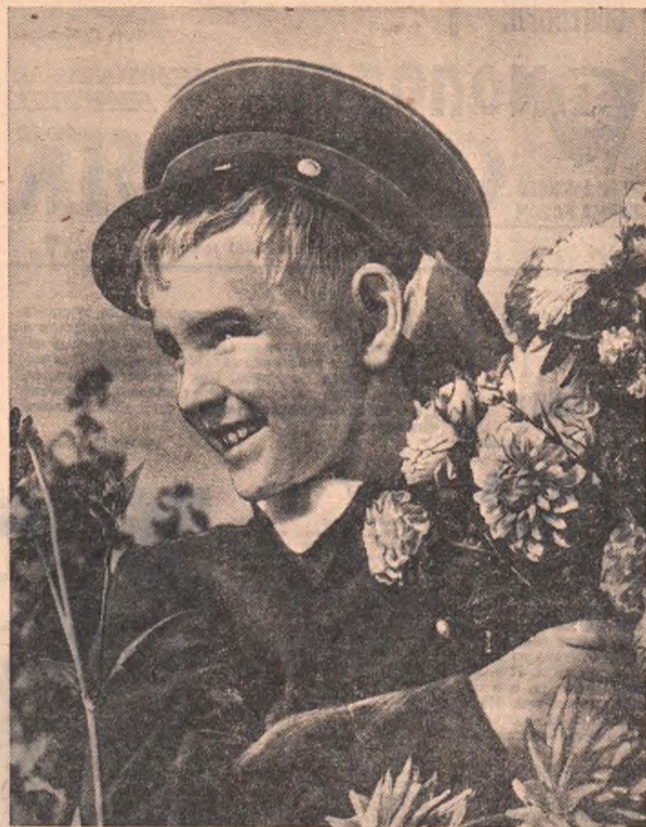
Первый раз в первый класс.

Расспросов в то утро было много. Всех ин-