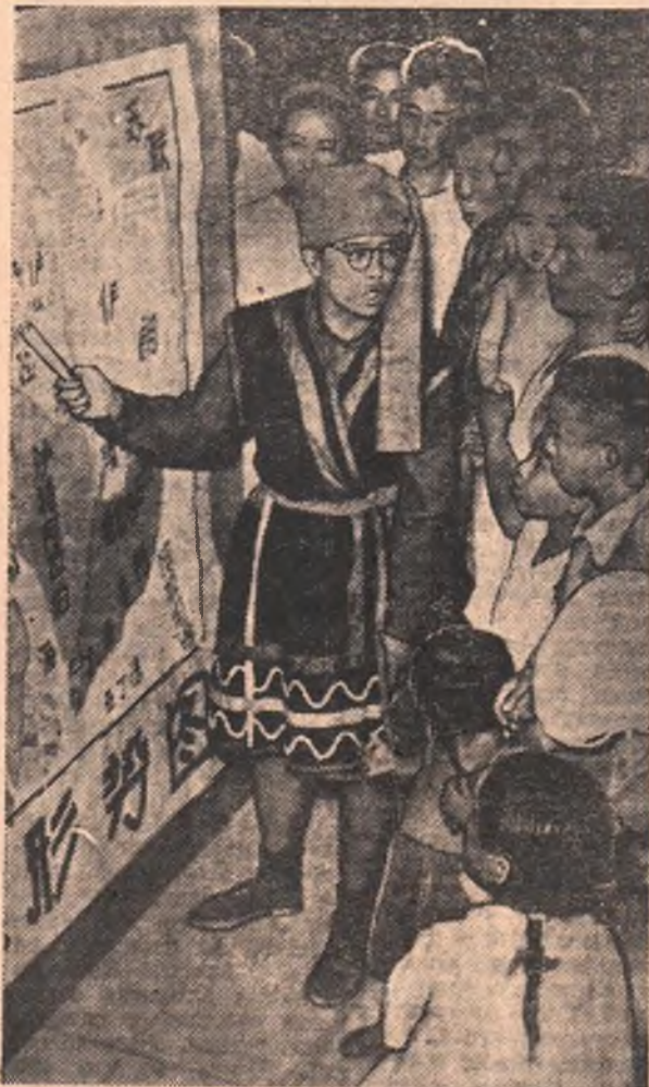
Трудящиеся Китайской Народной Республики с напряженным вниманием следят за развитием событий на Ближнем Востоке.

КИНОТЕАТР ИМЕНИ МАЯКОВСКОГО — «Когда чувства побеждают рассудок». (Розовый зал) — в 9, 10-45, 12-30, 2-15, 4, 5-45, 7-30 и 9-15 веч. (Голубой зал) — в 9-30 11-15, 1, 2-45, 4-30, 6-15, 8 и 9-45 веч. «ХУДОЖЕСТВЕННЫЙ» — «Песня первой любви» — в 9-50, 11-45, 1-40, 3-35, 5-35, 7-35 и 9-35 веч. «МАЯК» — «Бессмертная песня» — в 1 и 4-50 дня. «Смерть велосипедиста» — в 3, 6-40, 8-20 и 10 ч. веч. «ЛУЧ» — «Тайна мурого рыболова» — в 10 ч. утра. «Комсомольск» — в 11-40, 4-45 и 10-20 веч. «Мистер Инс» — в 1-10, 3, 6-45 и 8-30 веч.