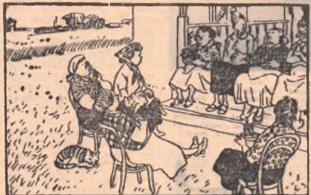
От утра до самой ночи. От безделья «лясы точат». А работать, между прочим, ни одна идти не хочет!..

Странно слышать от секретаря такое объяснение. Срывается подработка зерна, а Клышников и комсомольцы не в состоянии объявить лодырям беспощадную борьбу.