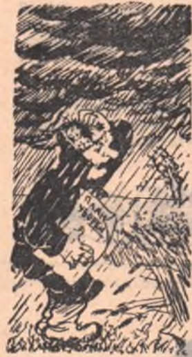
— Что ты рано в гости, Осень, к нам пришла? План мой еще просит Света и тепла!..