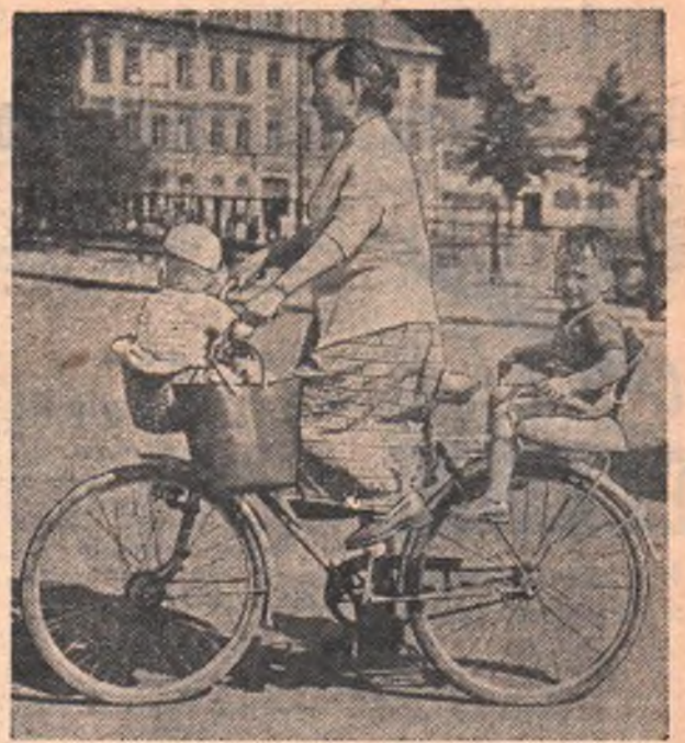
Швеция. Стокгольм. Уличная сценка.