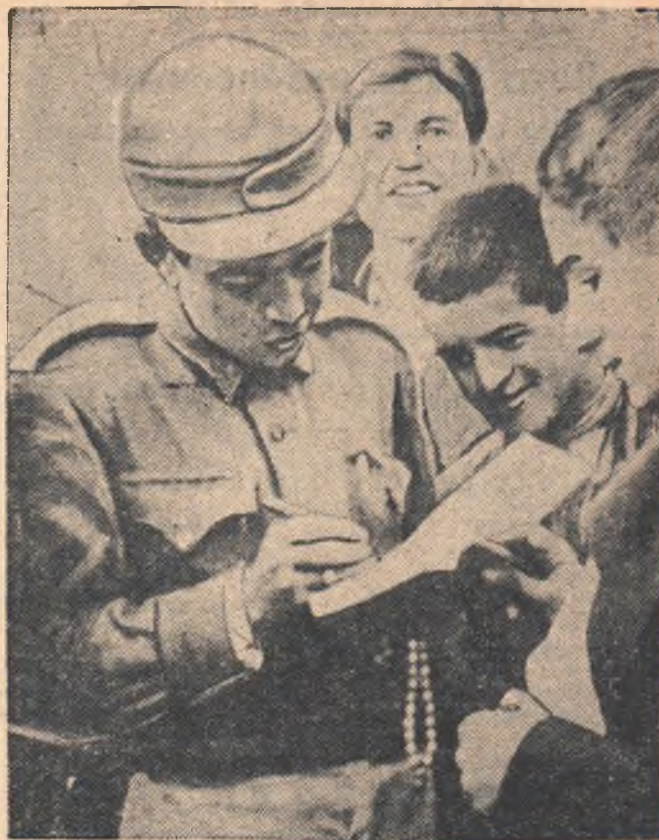
Простые люди Ирана — рабочие, крестьяне, ремесленники, передовая интеллигенция — все громче поднимают свой голос в защиту Мира. Успешно проходит сбор подписей под Обращением Всемирного Совета Мира о заключении Пакта Мира между пятью великими державами.

Несмотря на гонения, к Обращению присоединяются также солдаты иранской армии.