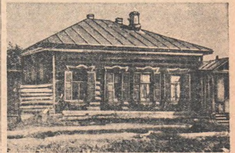
В этом доме (ул. Куйбышева, 67) жил в 1906 году В. В. Куйбышев. 20 ноября этого же года здесь проходила городская партийная конференция.

Здесь Валериан Владимирович установил связь с подпольным комитетом РСДРП и вскоре был введен в состав го-