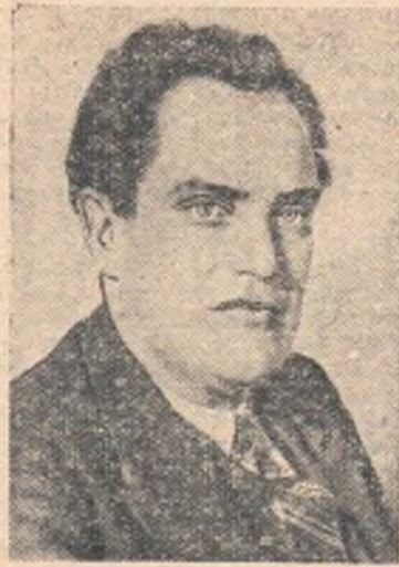
В. В. КУЙБЫШЕВ.

В эту квартиру к сестре приходил Валериан... Он приходил в своем военном мундир-