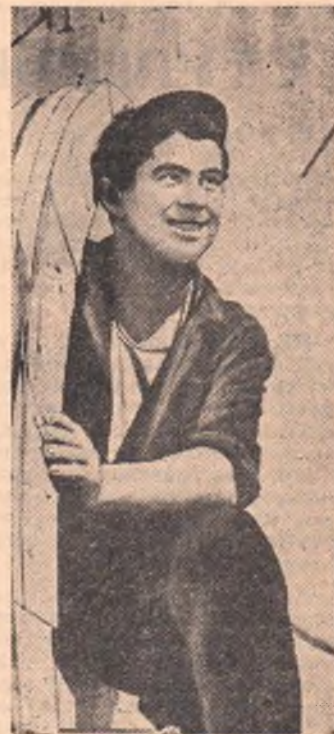
Дагестанская АССР. На левом берегу реки Сулак строится Чирюртовская ГЭС. На головном сооружении монтируется арматура, начата сборка секций труб напорного трубопровода, строится стационный узел.

Стройку эту можно назвать молодежной. В нынешнем году в республике был брошен клич: «Молодежь — на СулакГЭС-строй!» Сотни юношей и девушек Дагестана откликнулись на этот призыв и приехали на стройку. Многие из них приобрели здесь профессию.