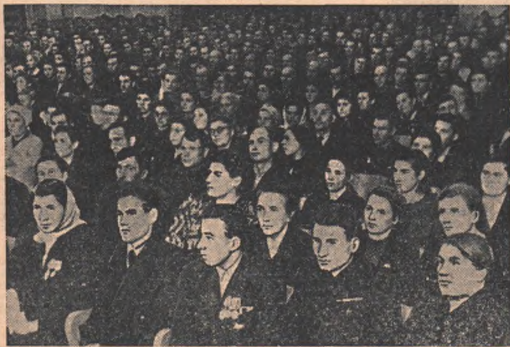
НА СНИМКЕ: в зале заседания конференции.