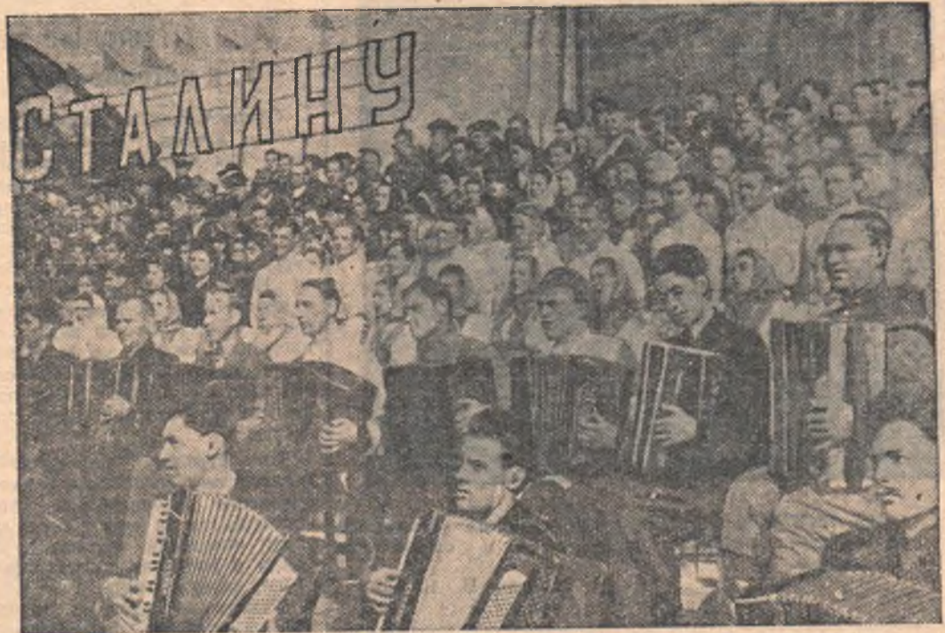
НА СНИМКЕ: группа баянистов и аккордеонистов сводного хора.

Единодушно, горячо, взволнованно участники митинга принимают текст приветственного письма вождю народов товарищу Сталину.