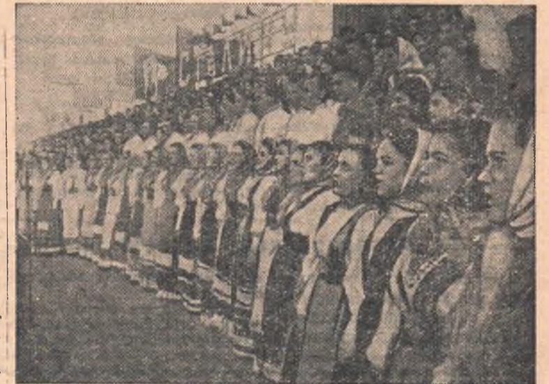
НА СНИМКЕ: сводный хор исполняет «Песню о Сталине».