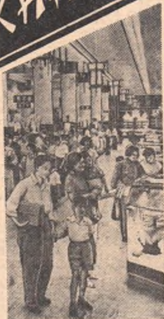
В городах Китайской Народной Республики открыто множество универсальных магазинов. В продажу поступает широкий ассортимент товаров народного потребления. На снимке: в одном из торговых залов Шанхайского универмага № 1.