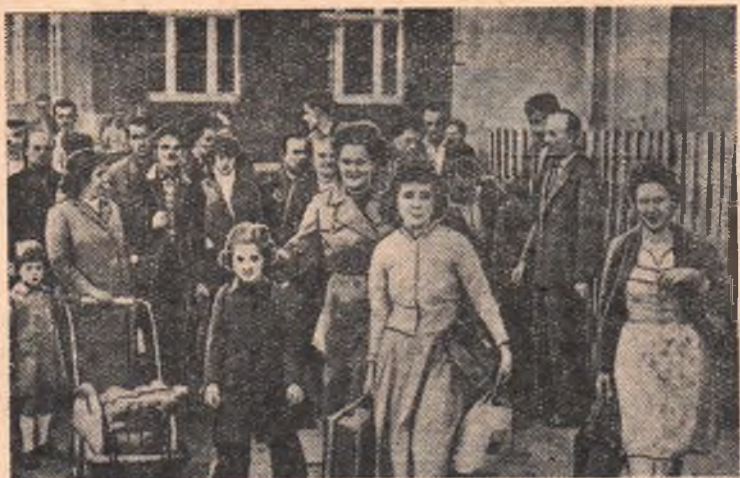
Поток жителей Западной Германии, переходящих в Германскую Демократическую Республику, не ослабевает. В течение двух недель сентября ежедневно в Германскую Демократическую Республику переселялось более 200 жителей из Западной Германии.