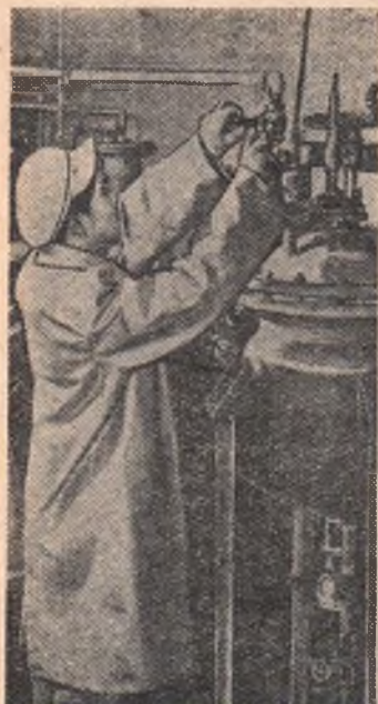
Китайская Народная Республика. В центральной лаборатории Шанхайского химического завода создан новый материал для изготовления пластмасс. Работники лаборатории получили поливинилхлорид из спирта. На предприятии налажено опытное производство этого материала. Агентство Синьхуа.

Западноберлинские газеты каждый день сообщают читателям о непрерывающихся бесчинствах хулиганов в возрасте от 16 до 25 лет. Целая серия преступлений имела место на прошлых неделях в различных районах Западного Берлина. В районе Гру-