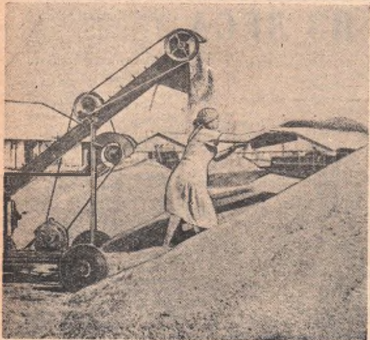
Полным ходом идет подработка зерна в совхозе «Цветочный». На центральном току трудится в основном молодежь, трудится добросовестно, по-комсомольски.

Передовому шоферу Калачинской автороты недавно вручен переходящий вымпел райкома ВЛКСМ.