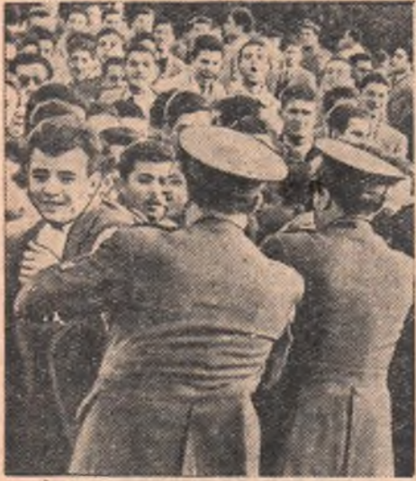
Греция. Недавно в Афинах состоялась демонстрация студентов в поддержку борьбы киприотов за самоопределение Кипра. НА СНИМКЕ: афинская полиция пытается оттеснить и рассеять демонстрантов.