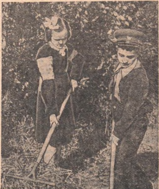
Активное участие в подготовке приусадебного участка для осенних посадок принимают пионеры и школьники начальной школы № 20 Омской железной дороги.

Н. БУРЯК, инструктор Куйбышевского райкома КПСС.