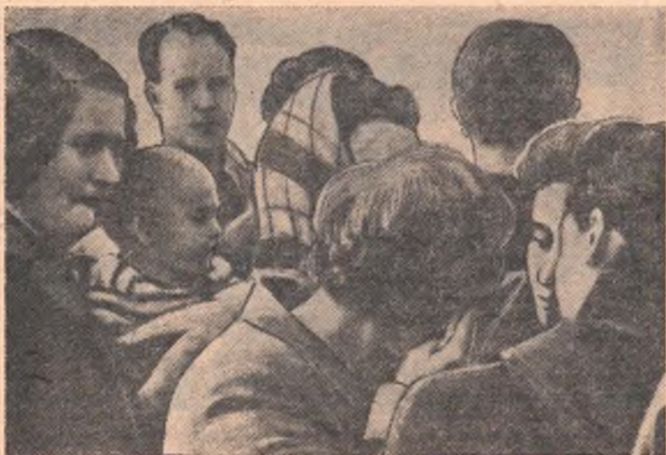
23 сентября текущего года «Молодой сибиряк» сообщил о том, что на угольной шахте в Крайстоне около Глазго произошел сильный пожар. 45 шотландских шахтеров оказались в ловушке под землей на глубине

300 метров. Попытки спасательных команд пробиться к ним не увенчались успехом. Все горняки погибли.