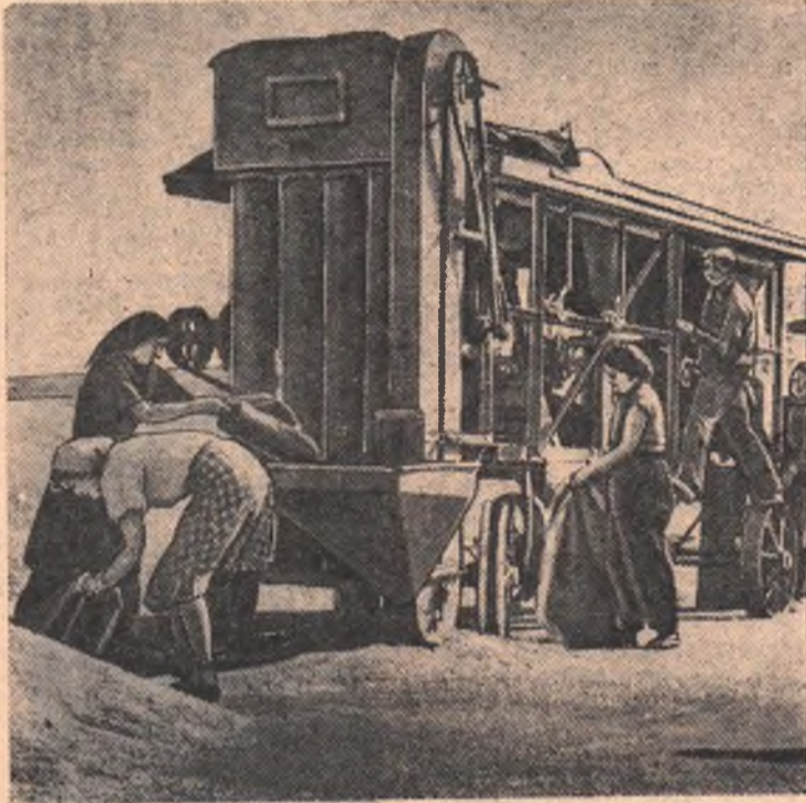
Богатый урожай собрали нынче труженики совхоза «Цветочный». На этом снимке вы видите совхозный ток. Хорошо, добросовестно работала молодежь на очи-

С. ПУШКО, мастер производственного обучения.