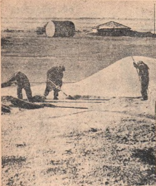
Книит работа на току совхоза «Целинный».