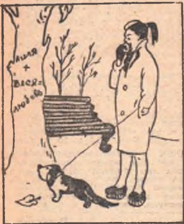
— Ищи, Мурзик, ищи... Изошутка В. Семенова (Омск).

ет лаконичное и очень театральное оформление художника Н. Эпова. В едином «ключе» играют и все актеры. Каждому из них приходится исполнять по десятку ролей самого различного плана. Кажется, что это не 12 исполнителей, а огромная галерея типов, характеров, образов. В. Корещин играет хулигана, играет зло, беспощадно к своему «герою», за три-четыре минуты раскрывая его убожество, его трусливую наглость.