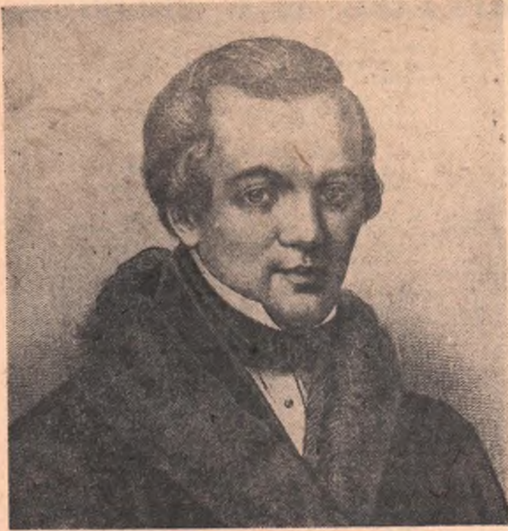
Завтра исполняется 150 лет со дня рождения (1809) А. В. Кольцова, выдающегося русского поэта.