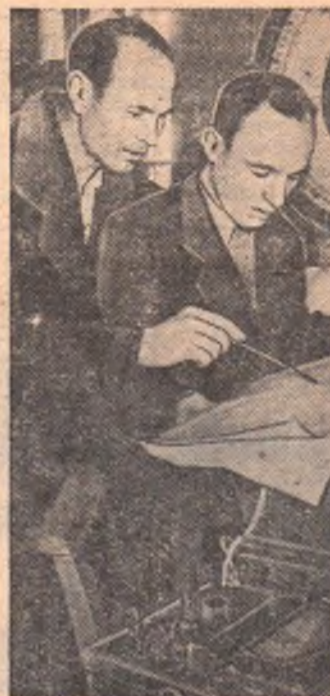
В Омском научно-исследовательском институте шинной промышленности идет разработка проблем автоматизации трудоемких процессов. Недавно коллектив лаборатории закончил изготовление действующей модели автодизеля, который работает с помощью перфокарт и имеет программное управление.