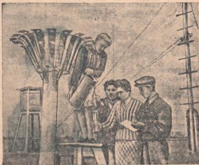
НА СНИМКЕ: студенты географического отделения на практике по гидрологии.