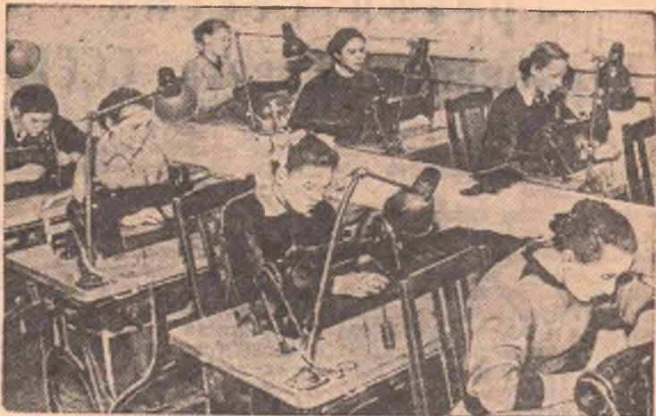
В омской одиннадцатилетней школе № 65 девочки-девятник-шестиклассницы обучаются швейному делу. На нашем снимке вы видите девятиклассниц за работой в школьном швейном цехе.