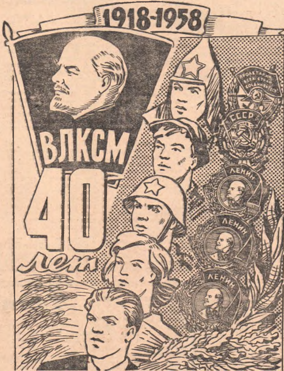
Рис. В. Жаринова.