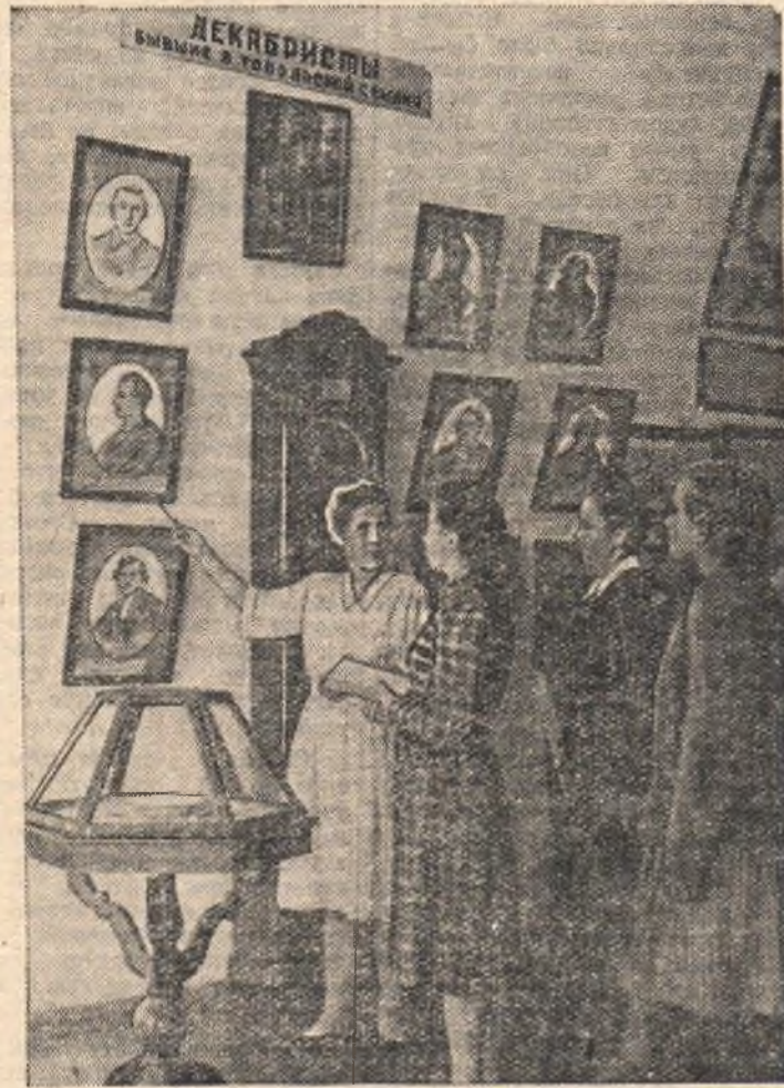
НА СНИМКЕ: учащиеся тобольских техникумов слушают рассказ экскурсовода краеведческого музея о жизни Фонвизина, Батенькова, Кюхельбекера, Бялятинского в Тобольске.

Почти великий поэт посвятил стихотворение «Мой первый друг, мой друг бесценный». О Пушкине А. С. Пушкин вспомнил и на смертном одре: «Как жаль, что здесь нет Пушкина, мне бы легче было умирать...» В Ялуторовске Пушкин создал «Библиотеку добрых листов», в ней было 1.400 писем от друзей декабристов. Эти письма, собствен-