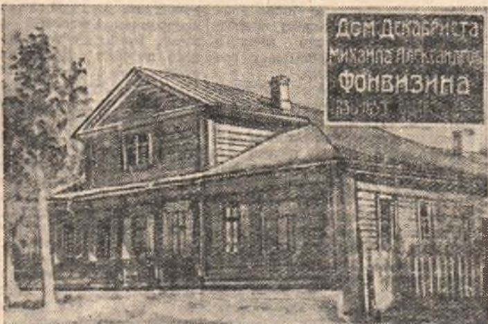
НА СНИМКЕ: Тобольск. Дом, в котором жил в период ссылки декабрист М. А. Фонвизин; в правом углу — мемориальная доска.