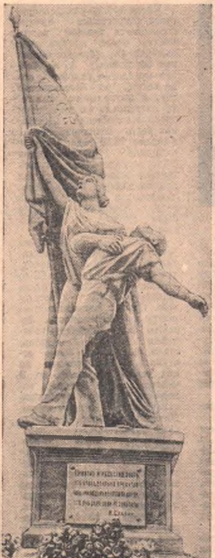
Памятник павшим борцам революции установленный на площади имени Ленина в Омске.

Солнце новой жизни сияет над Сибирью. Вместе со всем советским народом идут омичи широкой дорогой семилетки, и каждый знает: нам завтрашний день будет еще светлей и радостней, чем сегодняшний.