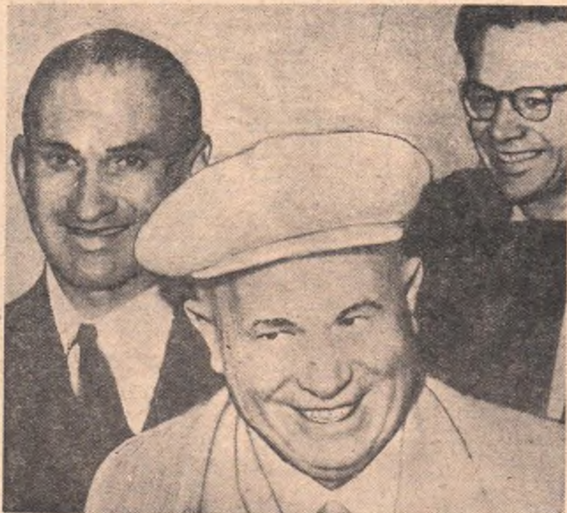
Кадр из фильма «Н. С. Хрущев в Америке».