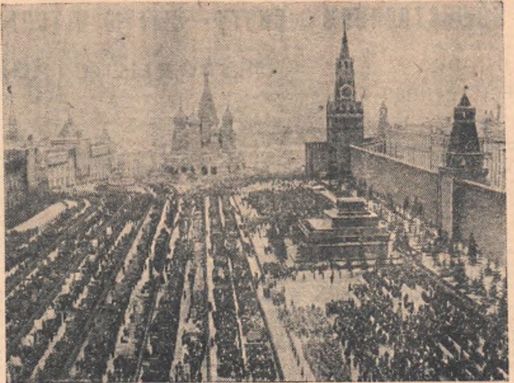
Празднование 34-й годовщины Великой Октябрьской социалистической революции в Москве. НА СНИМКЕ: демонстрация трудящихся на Красной площади.