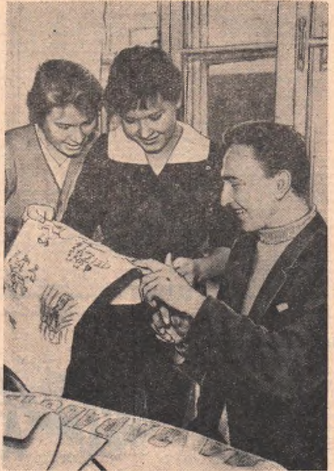
Боевую стенную газету выпускает редколлегия Омского финансово-кредитного техникума. С начала октября здесь выпущено четыре номера газеты, которые вызвали живой интерес у учащихся.