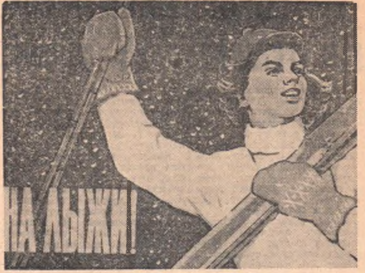
Планат работы художника К. Ми- стакиди (ИЗОГИЗ).

тельного института, он четыре года работал на строительстве Волжской ГЭС, а затем был направлен сюда.