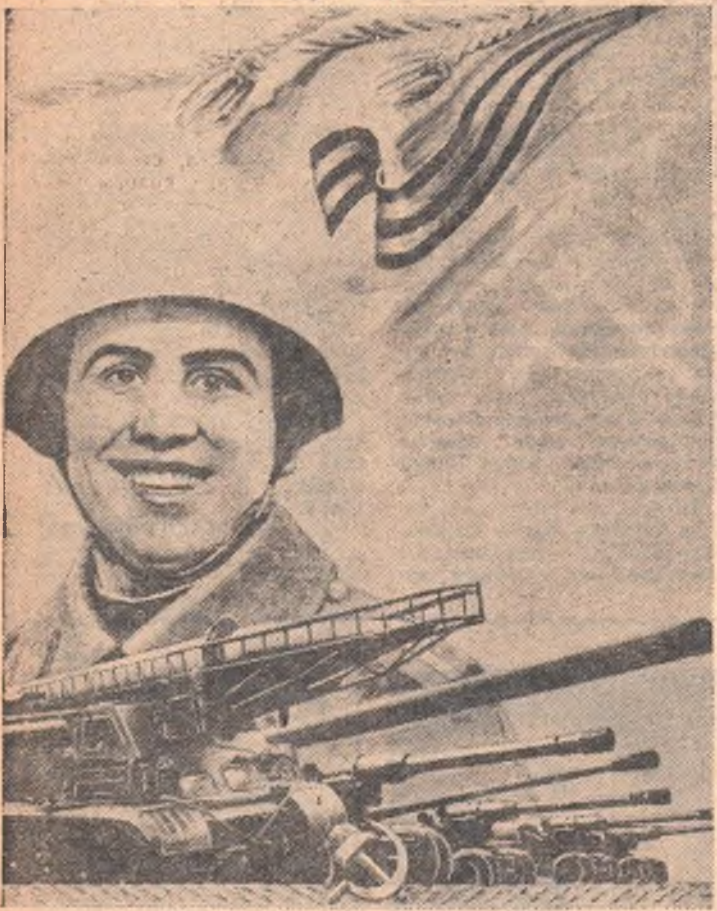
Фотомонтаж А. Антонова.