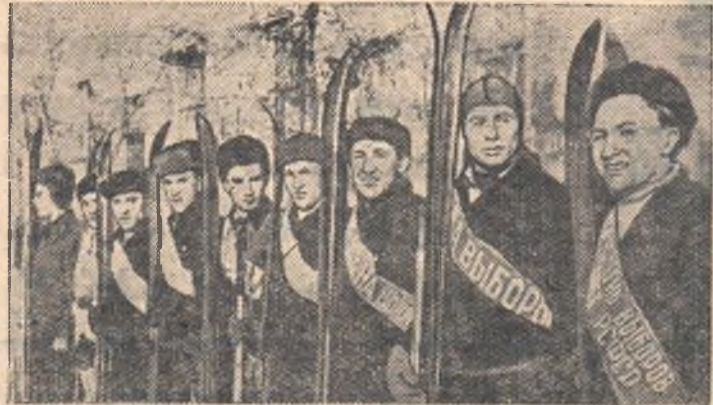
НА СНИМКЕ: лыжники автодорожного института перед походом.

Сегодня мы рассказываем о том, как в отдельных вузах и техникумах города проходят каникулы и как руководят отдыхом молодежи комитеты комсомола.